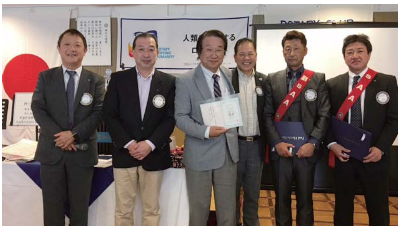
財団・米山表彰の会員方